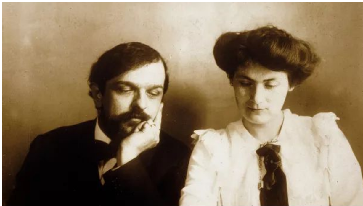
Claude Debussy avec sa première épouse Rosalie Texier (Lilly) vers 1902.

1899.g. D. aprecas ar modeli Rozalī Teksjē ar skatuves vārdu Lilī . Pirms tam 9 gadus dzīvoja kopā ar Rozālijas labāko draudzeni.