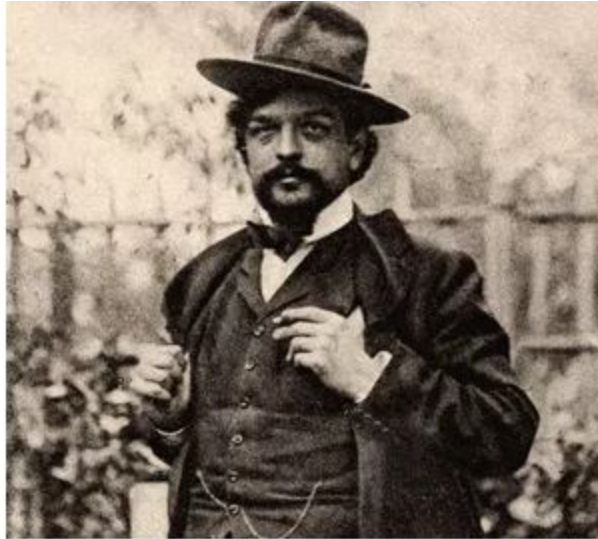
Claude Debussy vers 1902.