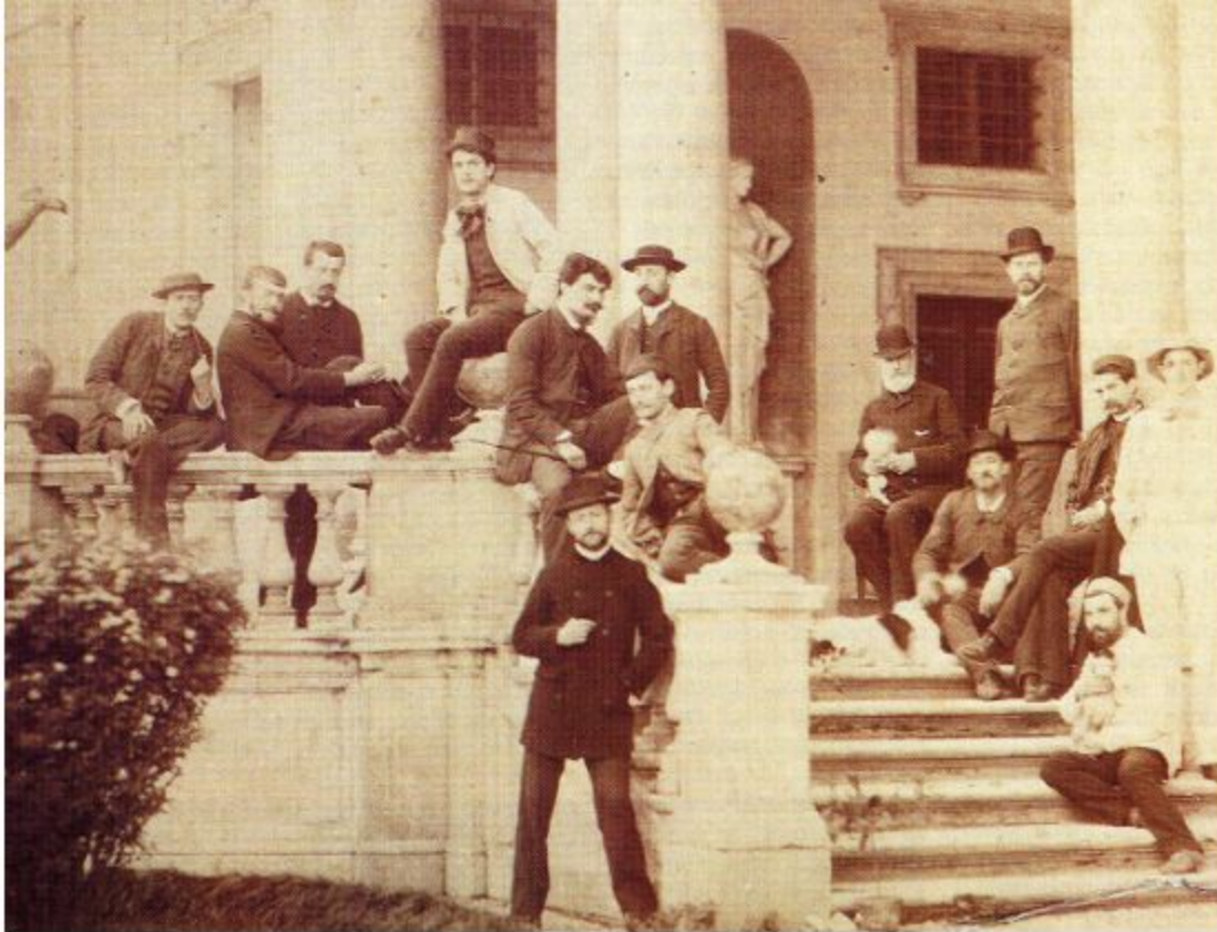
Claude Debussy at the Villa Medici in Rome at the centre in the white jacket (1885)

Itālijā top jau Debisī rokrakstam raksturīgie darbi : Kantāte (pats apzīmē kā Liriskā poēma ) “ Izredzētā Jaunava ” 2 balsīm un orķestrim;