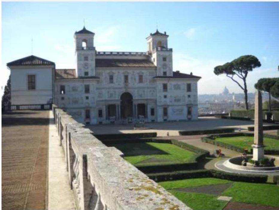
Villa Medici in Rome, Italy

1885.g. Debisī saņem lielo Romas prēmiju, iespēju studēt Romā, Mediči villā – par oratoriju „Pazudušais dēls”-Bībeles sižets.